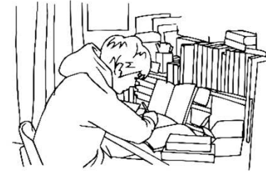
家庭(自習室)での学習