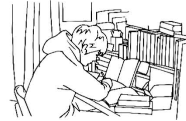
家庭（自習室）での学習