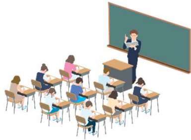
東進ゼミナールの授業