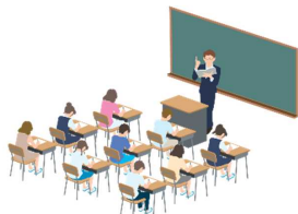
東進ゼミナールでの授業