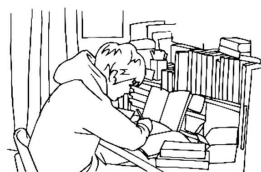
家庭または東進での自習